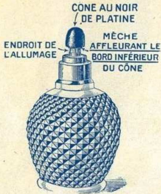
Lampe en fonctionnement

La LAMPE HYGIÉNIQUE BERGER est unique, grâce à son cône au noir de platine, qui neutralise et absorbe toutes les fumées et odeurs désagréables ou insalubres.