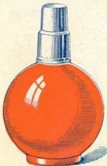
Fig. 1 Lampe au repos

La lampe doit fonctionner par incandescence, sans flamme.